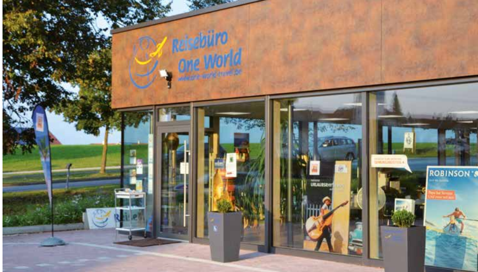
Neuer repräsentativer Firmensitz am Altusrieder Kreisverkehr.